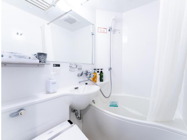
シングルルーム (スタンダード)